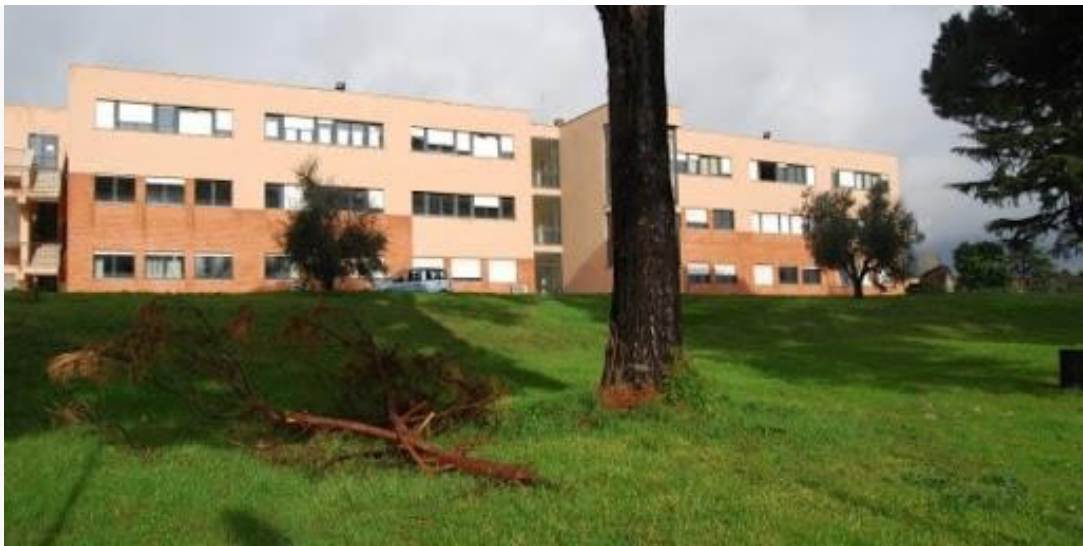
Sede via Parri