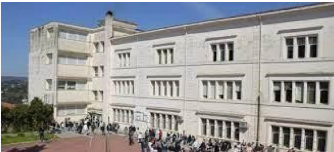
Sede via Parri